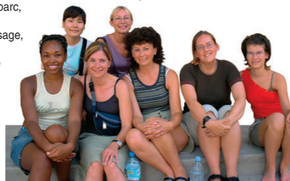
← Mon prof.

Sur le campus Tous les services du Collège : salles de classe, chambres, Wifi et salle internet (gratuit), réfectoire, cafétéria, terrain de volley-ball, gymnase, bibliothèque, salle T.V. et vidéo, administration, infirmerie, salle de théâtre-cinéma, terrasse dans le parc, machines à laver et salle de repassage, parking, réception ouverte 24h/24.