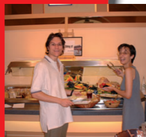
← Le brunch Internat sur le campus