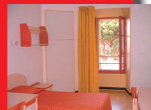
↑ Ma chambre